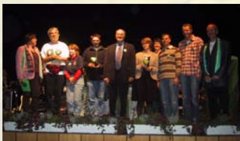
Die Preisträger 2007